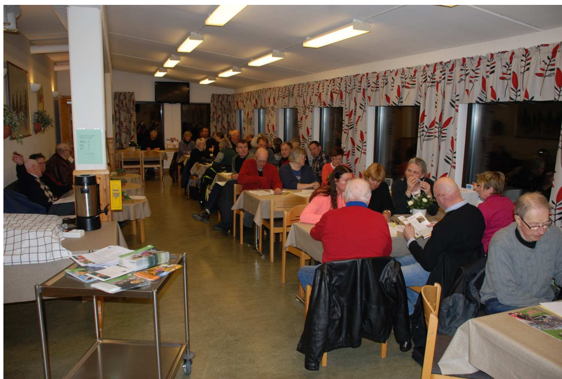
Medlemmarna bjöds efter årsmötet på förtäring bestående av fläskfile med potatisgratäng.